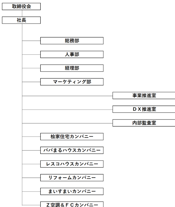
株式会社 ヒノキヤグループ 組織図（2023年7月1日付）