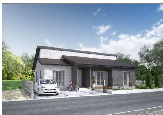
「軽井沢の家－Hiraya Luxury－」の外観イメージ

「軽井沢の家－Hiraya Luxury－」は、同社が今年4月1日（日）に発売開始した新商品で、軽井沢でのセカンドライフをイメージした贅沢な空間を演出した平屋のプランです。また、「神栖 PaPamaru 展示場」は同社の単独展示場であり、49坪二階建てのリアルサイズモデルハウスも隣接しています。