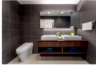
FUGA Duo（フーガ デュオ）