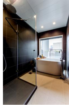
ラグジュアリーバス