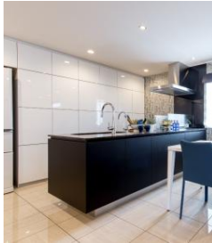
キッチンウォールキャビ & クチーナ・グランデ

れる仕様とし、一年中家の中を快適にする「Z空調」が搭載されているほか、ヒノキヤグループのメリットを活かし多くのオリジナル商材を採用。キッチンには高級インテリアを思わせるデザイン性と機能性を追求した「クチーナ・グランデ」と「キッチンウォールキャビ」。洗面脱衣所にはラグジュアリーかつ実用性の高い「FUGA Duo（フーガ デュオ）」。またレスコハウスの頑強PC構造を活かし、浴室には上質なくつろぎを演出する『ラグジュアリーバス』を、屋上にはプライバシーが守られた庭やセカンドリビングとしても活用できる「青空リビング×COLORS」を設置しています。