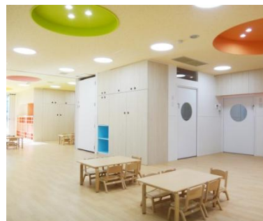
「HUG 高輪」イメージパース と 内観写真