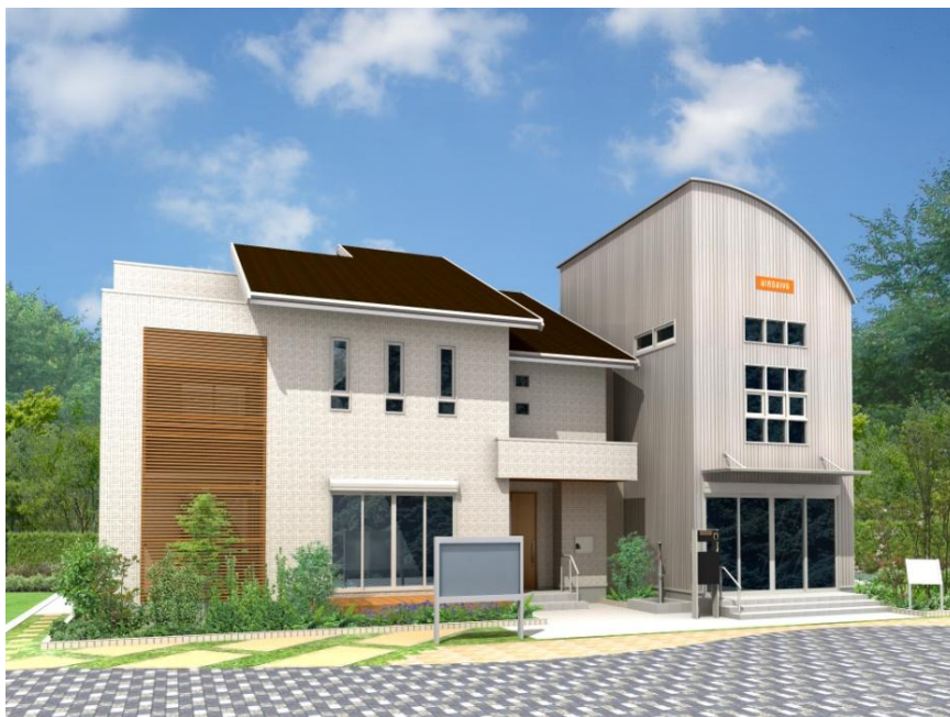
静岡県初の直営となる「清水展示場」外観イメージパース