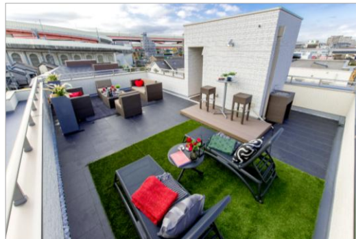
屋上庭園「青空リビング×COLORS」（イメージ）