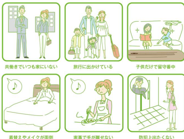
共働きでいつも家にいない